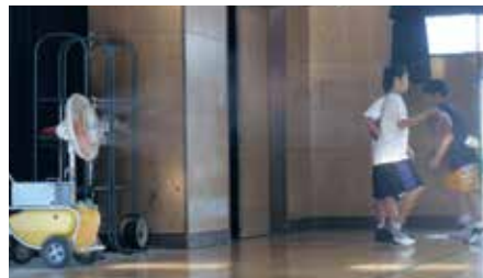
屋内(体育館)(熱暑対策)