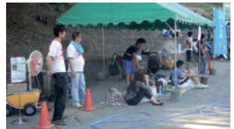
屋外(仮設テント)(熱暑対策)