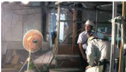
屋内(休憩所)(熱暑対策)