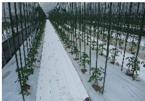
写真右 ルンルンシート白ピカ