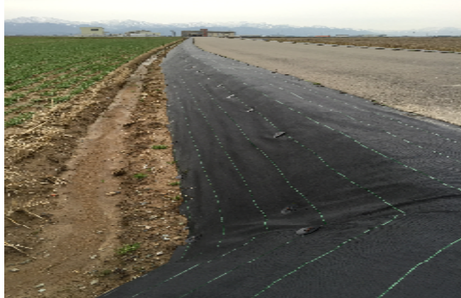
写真左 ルンルンシート黒

防草シートを利用した雑草対策は最初の設置に手間がかかるものの、一回設置してしまえば数年間は張替えの必要がありません。また、様々な幅、色があり、多くの場所で使用することができます。水を通すものもあり、苗床や通路など、水が溜まってしまうと困る場所にも使用できる商品もございます。ひとくりに防草シートといっても多くの種類があり、除草剤と同様に用途や使用する場所によって選択しなければいけませんので、ご購入の際にはご相談ください。