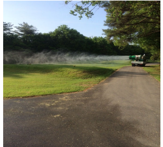
スパウダーによる緑地管理の様子（30m到達機種）

弊社では「無人ヘリ」、「スパウダー」など、常にお客様のお役に立てる散布体制を保つため今後とも安全で効率のよい機械の導入を続けていくにしています。