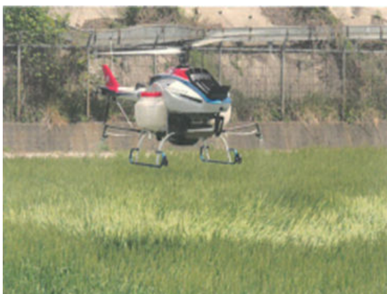
弊社所有の無人ヘリ

無人ヘリは現在全国で約2,500台が登録されており、防除面積は、水稻に限っていえば日本の全水稻面積の35%を超える水田で、延べ100万ヘクタール以上にわたって使用されています。また、無人ヘリでの作業はこれまで薬剤の散布が中心でしたが、徐々に水稻直播（種子）・肥料などに使用されることが増えてきました。薬剤では粒剤の使用も増えています。今後は農業分野の幅広い場面や緑地管理などでの省力化、低コスト化に大きく役立つ機械です。弊社では今回導入した最新鋭機を含めて計5台の無人ヘリを装備し、ご要望に応じていくことにしております。