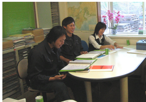
活発な質問も出された勉強会の様子

これは、前回2011年3月15日の本社における第1回目（樹木医研修おすそわけ、通巻23号にそ